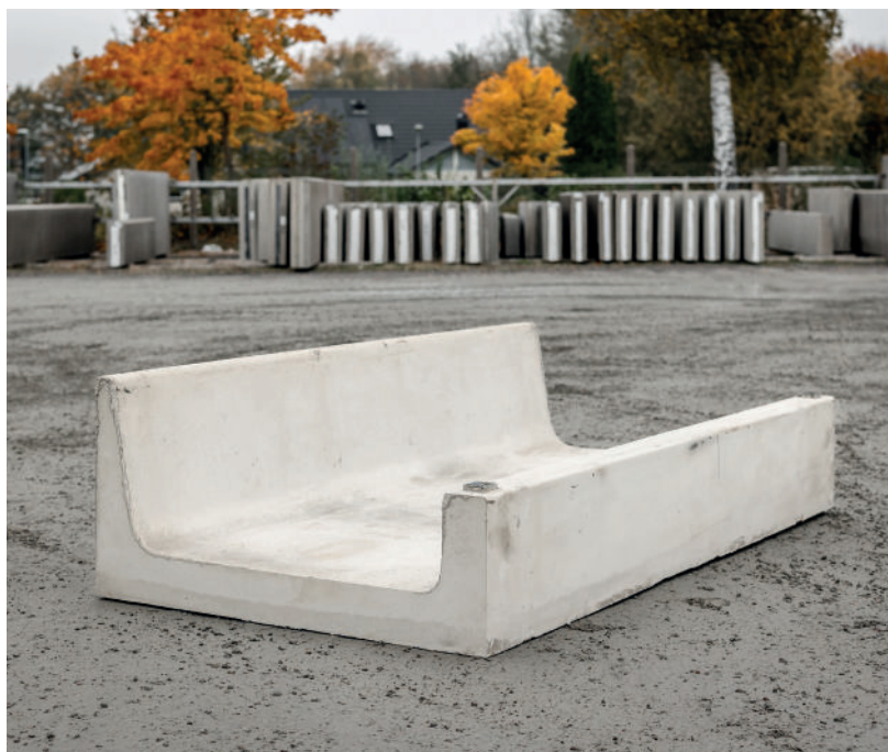
Foderkrubba med grindfäste