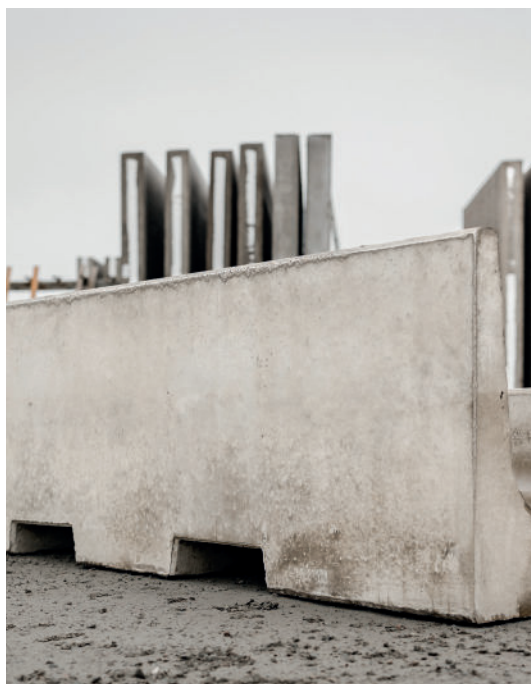
Urtag för lastgafflar vid montage.