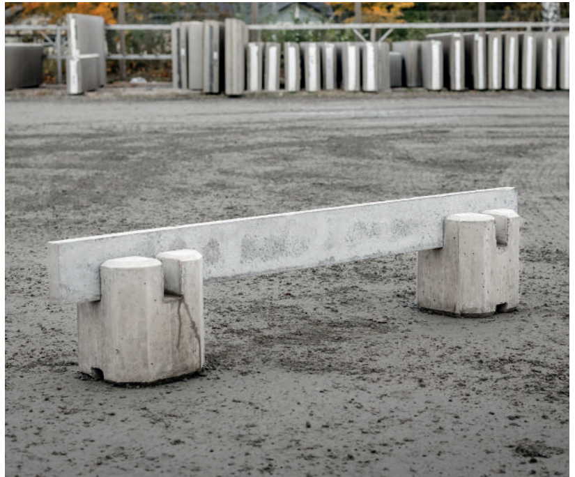
Trafikbarriär med tillhörande balk som avdelare